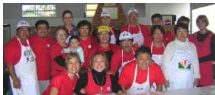
Equipe ACENIBRA de Peruíbe... à disposição!!!