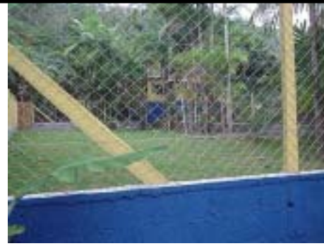
Amplio campo gramado de agility!!!