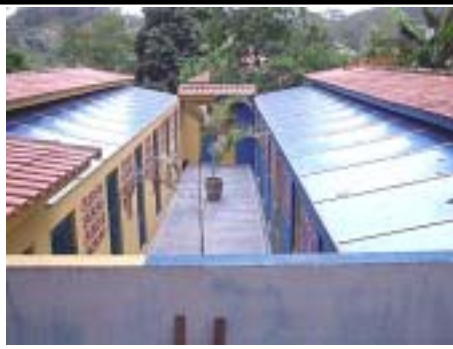
Canis individuais, higienizados diariamente, cobertos e seguros!!!