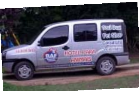
Veículo preparado para um delivery seguro e adequado do seu amiguinho!!!

Piscina para recreação ou reabilitação do seu amiguinho canino e uma linda capela!!!